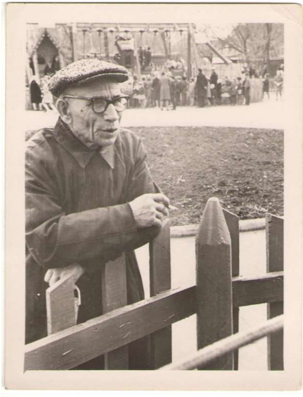
Ветеран во дворе своего дома, 1972 год.