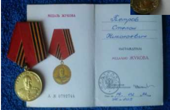
Фотографии некоторых медалей прадедушки.