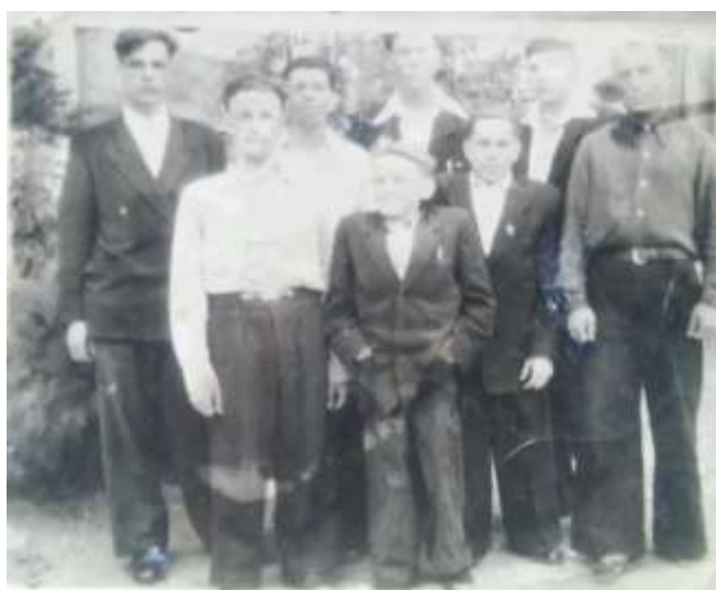
Прадедушка с односельчанами.