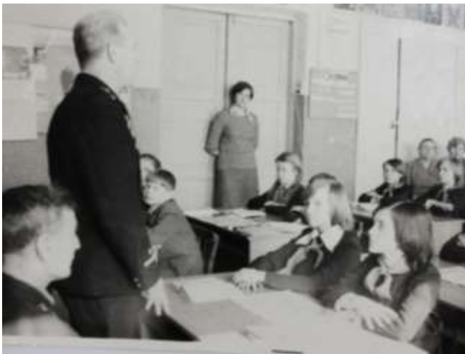
Рассказы о войне пионерам 26 школы г. Сызрани, Куйбышевской области