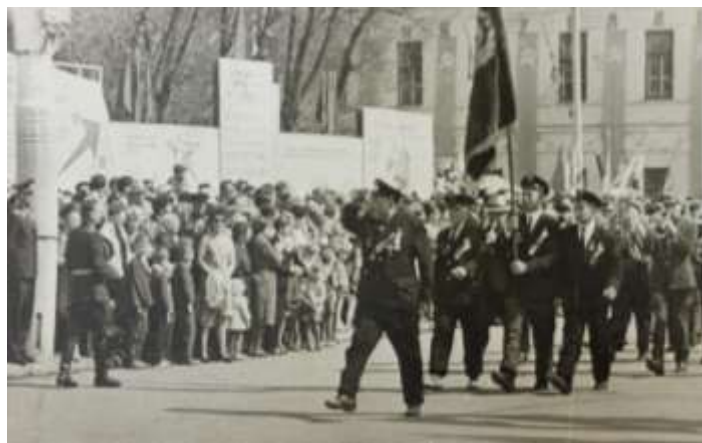
Знаменосец на параде Победы, 9 мая, г. Сызрань, Куйбышевская область.