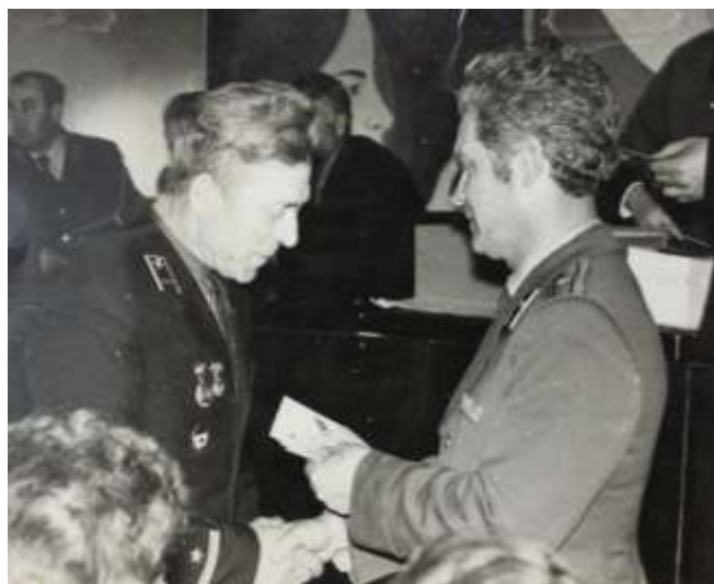
Вручение медали За Победу в Великой Отечественной войне военкомом г.Сызрани, Куйбышевской области.