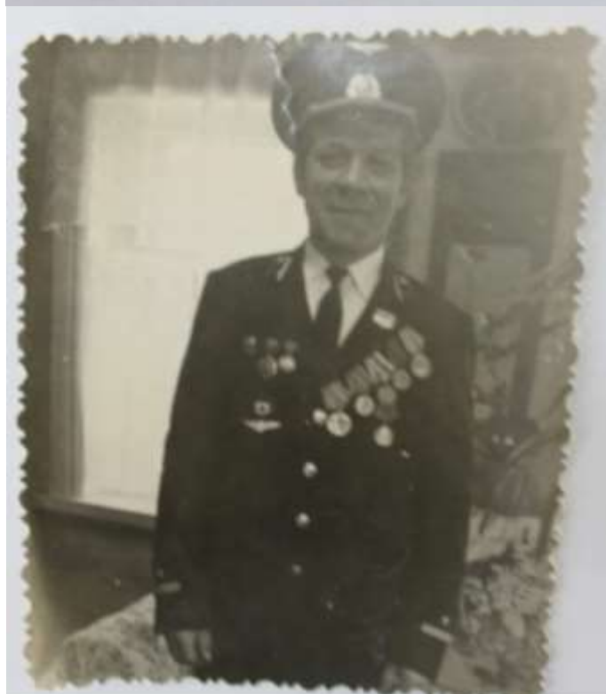
9 мая 1972 год, г.Сызрань.